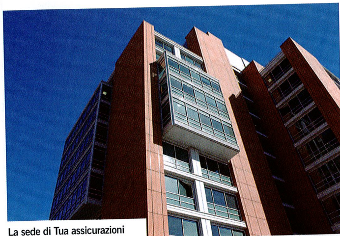
La sede di Tua assicurazioni

N essun intermediario può rilasciare determinate polizze intestate alla Forte Asigurari Reasigurari Sa (già Irasig Asigurari Reasigurari Sa), compagnia assicurativa con sede legale in Romania, Str. Cristian Popisteanu nr. 2-4, sector 1, Bucarest. A segnalarlo è l'Isvap, per il quale questa compagnia non rientra tra quelle abilitate all'esercizio dell'attività assicurativa in Italia per l'assunzione di contratti relativi ai rami assicurativi 13 (Rc generale), 14 (credito) e 15 (cauzioni).